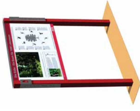
Tafel mit Informationen zu Eiche und Eichenwirtschaft